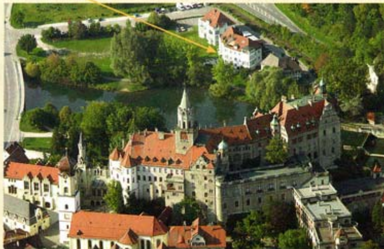
SIGMARINGEN IST IMMER EINE REISE WERT. DIE KLINIK BIETET EINEN ATEMBERAUBENDEN AUSBLICK AUF DAS SCHLOSS DER HOHENZOLLERN.